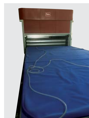
Medidas exteriores/exterior size